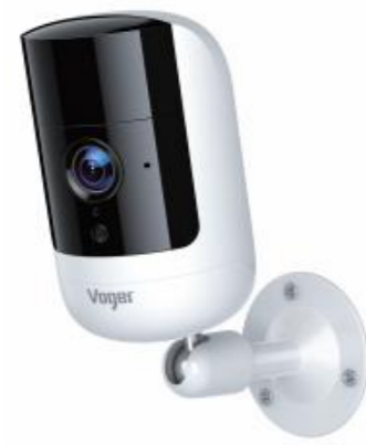
ME720 Security IP camera User Manual